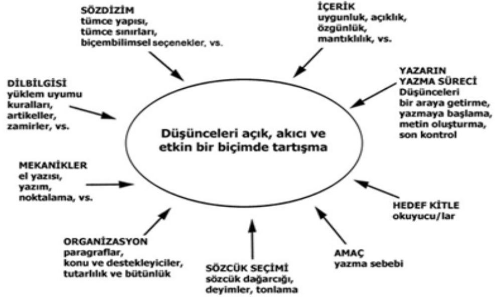
Şekil 1. Yazma Üretim Aşamaları; (Raimes, 1983: 6)

Sözü edilen ögeler şu şekilde gösterilmektedir: